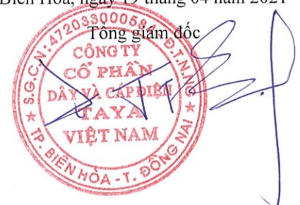
WANG TING SHU